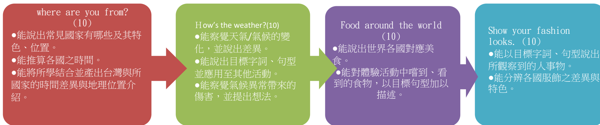
課程架構脈絡圖(單元請依據學生應習得的素養或學習目標進行區分)(單元脈絡自行增刪)