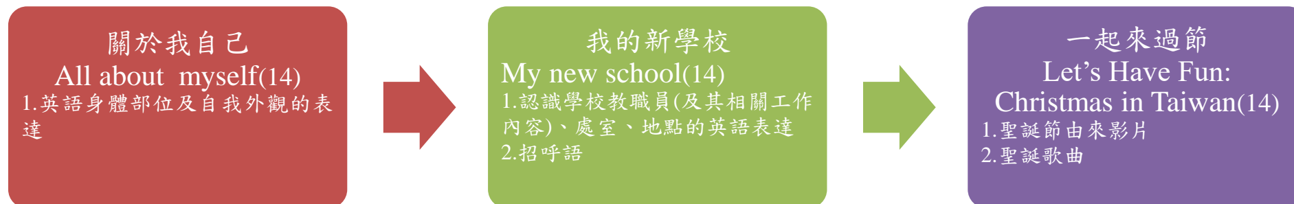
課程架構脈絡圖(單元請依據學生應習得的素養或學習目標進行區分)(單元脈絡自行增刪)