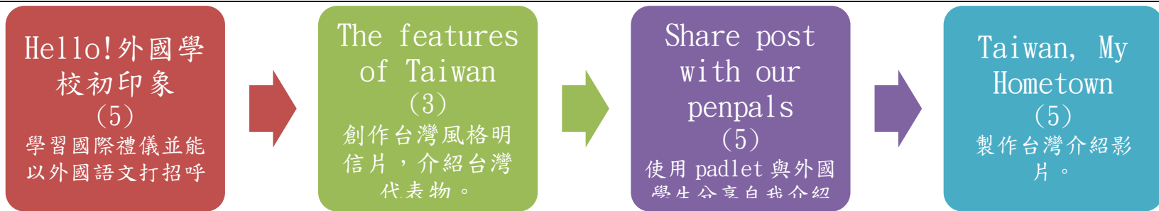
本表為第 1 單元教學流程設計/(本學期共 4 個單元)