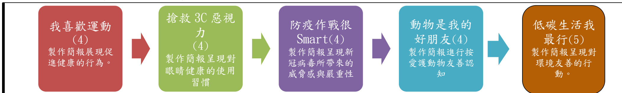
本表為第 1 單元教學流程設計/(本學期共 5 個單元)