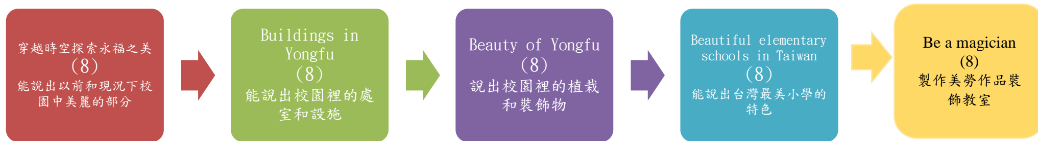
本表為第 1 單元教學流程設計/(本學期共 5 個單元)