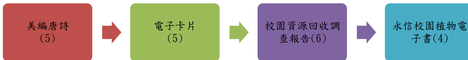
課程架構脈絡圖(單元請依據學生應習得的素養或學習目標進行區分)(單元脈絡自行增刪)