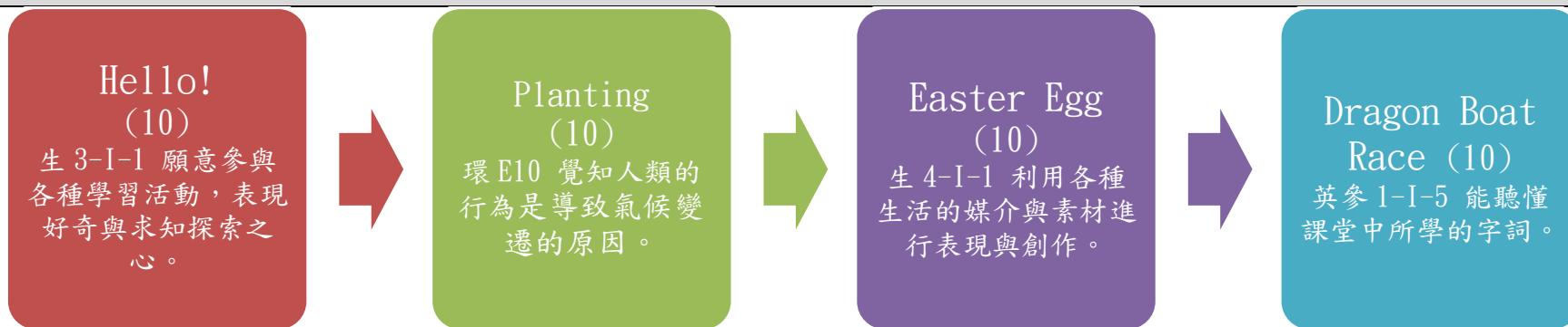
課程架構脈絡(單元請依據學生應習得的素養或學習目標進行區分)(單元脈絡自行增刪)