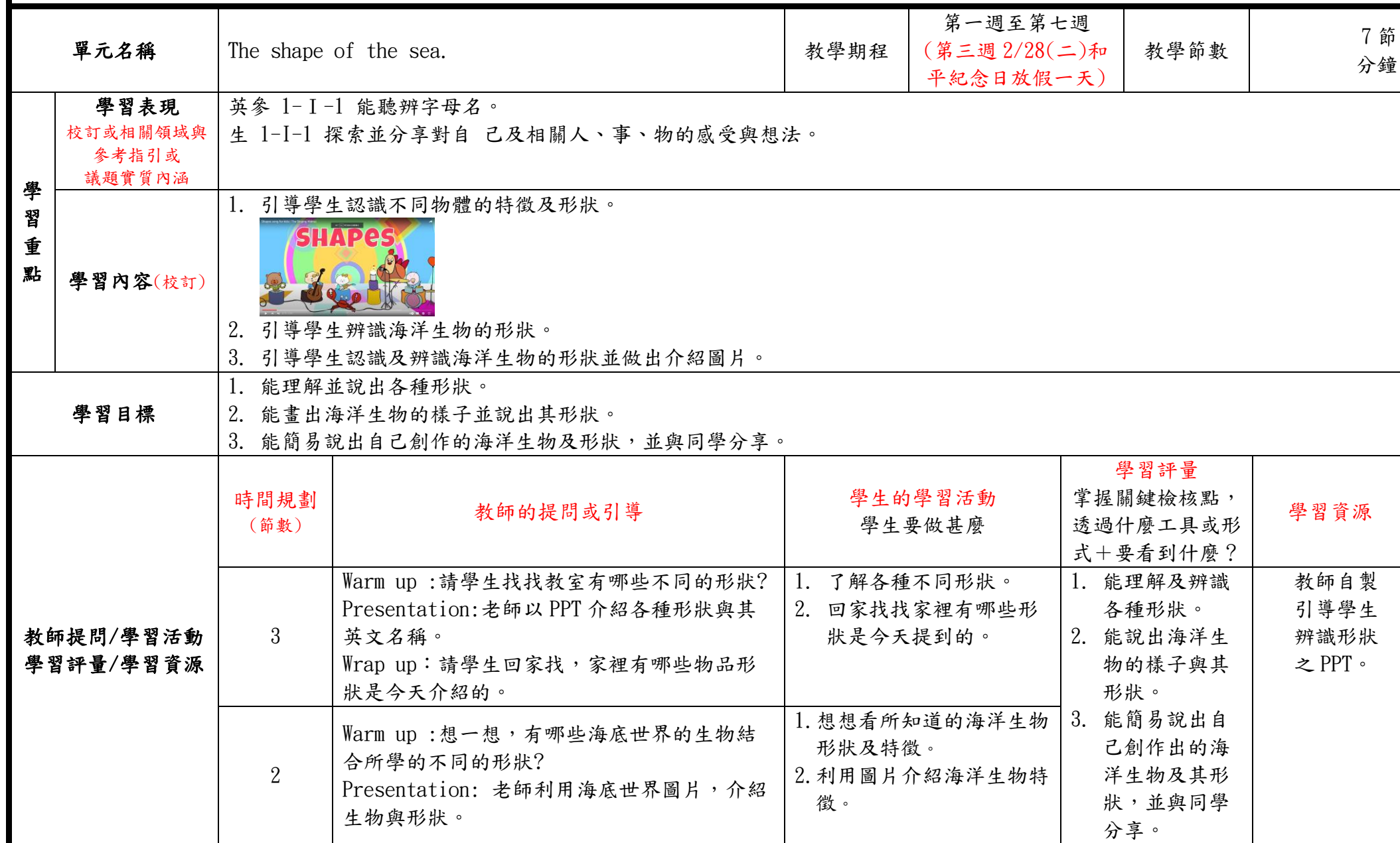
本表為第一單元教學流程設計/(本學期共三個單元)