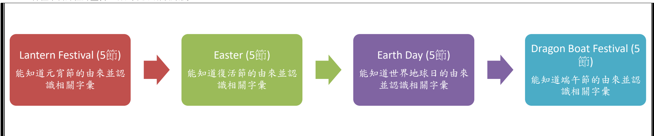
本表為第一單元教學流設計/(本學期共四個單元)