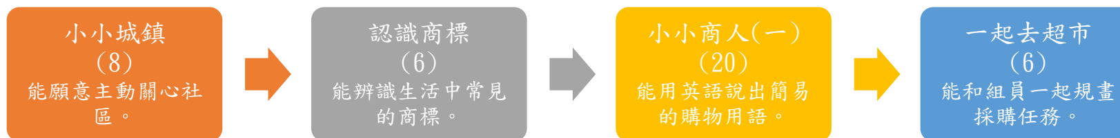
本表為第 1 單元教學流程設計/(本學期共 4 個單元)