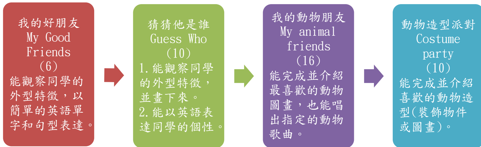
課程架構脈絡圖(單元請依據學生應習得的素養或學習目標進行區分)(單元脈絡自行增刪)