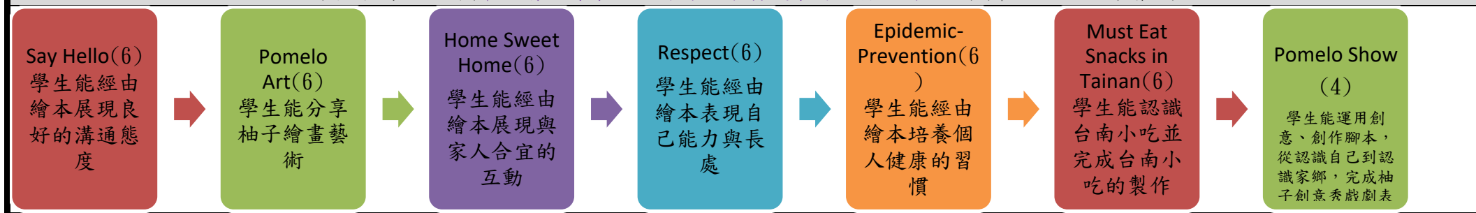
課程架構脈絡圖(單元請依據學生應習得的素養或學習目標進行區分)(單元脈絡自行增刪)