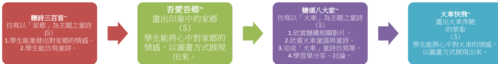
C6-1 彈性學習課程計畫(第一類)