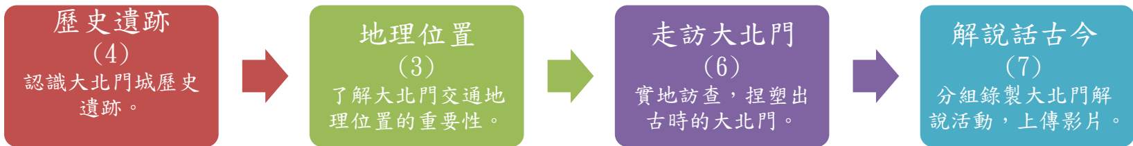
本表為第1單元教學流設計/(本學期共4個單元)