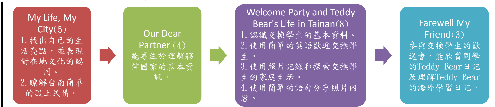
本表為第一單元教學流設計/(本學期共 4 個單元)