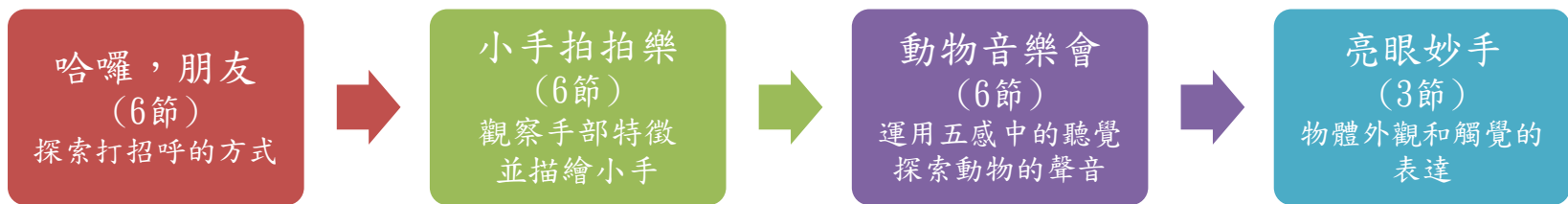
本表為第一單元教學流設計/(本學期共四個單元)