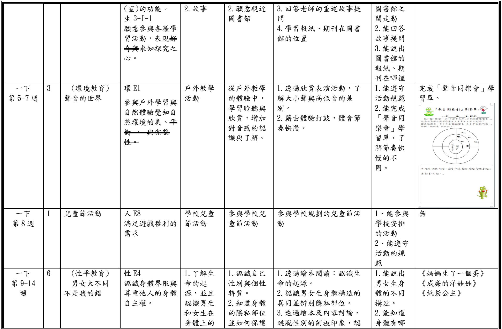
C6-1 彈性學習課程計畫(第一、三、四類)