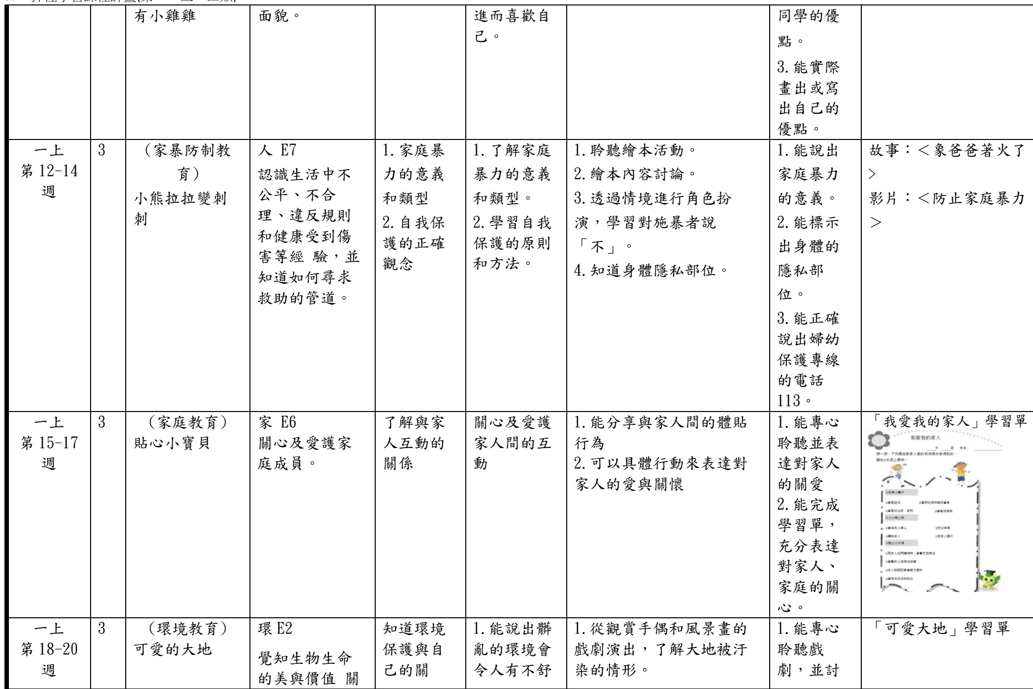
C6-1 彈性學習課程計畫(第一、三、四類)